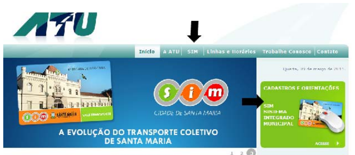
Figura-1 | Acesso ao formulário de cadastro – funcionários optantes pelo VTI Na página inicial do SIM.

Através do site ( www.atu.com.br ), acessar o ícone na página inicial ou o item de menu SIM, conforme indica figura abaixo: