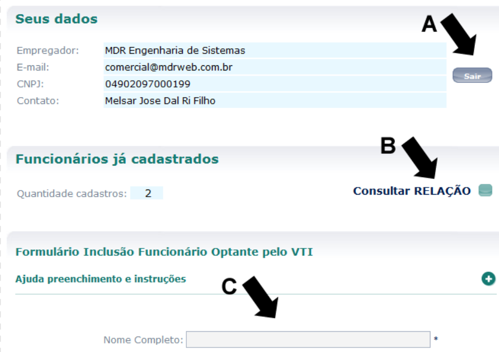
Figura-4 | Tela inicial usuário autenticado no site ATU: informações e links para os cadastros